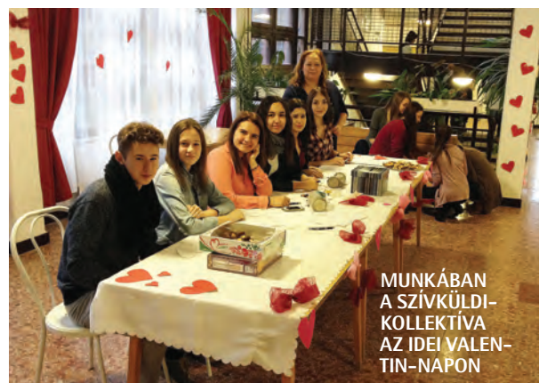
MUNKÁBAN A SZÍVKÜLDI-KOLLEKTÍVA AZ IDEI VALENTIN-NAPON

– Az első félévet és a februárt is sikeresnek látom. Úgy sikerült, ahogy elterveztem, ez reményre ad okot. Remek volt a Valentin-nap, rekordmennyiségű üzenetet kézbesítettünk. A rövidített szünetekben szóltak a romantikus számok, nagy munkát végeztek, bizonyítottak a szervezők. A tavalyi farsang elmaradt, idén már csak a kicsiknek