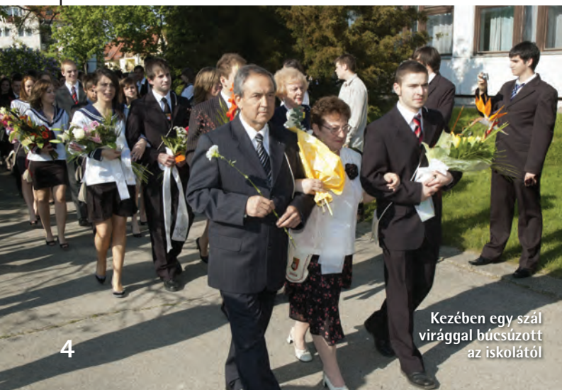
Kezében egy szál virággal búcsúzott az iskolától

„Természetesen a szép emlékeket őrzöm meg. Ha az ember leragadna azon, hogy milyen kellemetlenségek érik, akkor nem tudna foglalkozni az érdemi kérdésekkel. Persze a konfliktusok húsz év alatt nem voltak kizárhatóak, pláne olyan közoktatási káoszban, amelyet sokszor érzékelünk.”