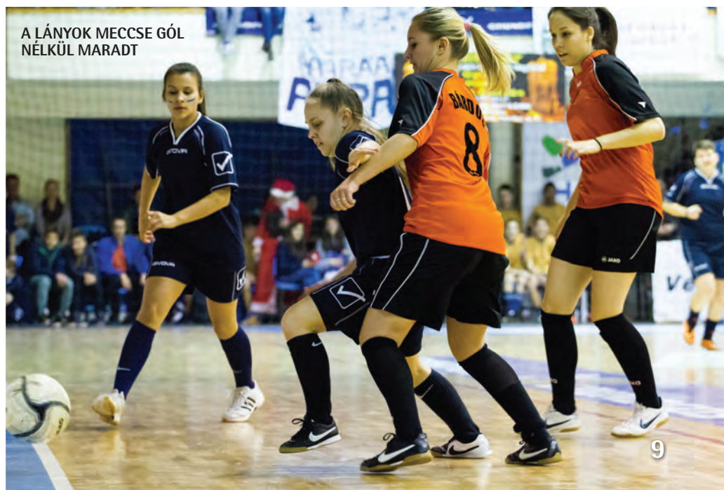
A LÁNYOK MECCSE GÓL NÉLKÜL MARADT