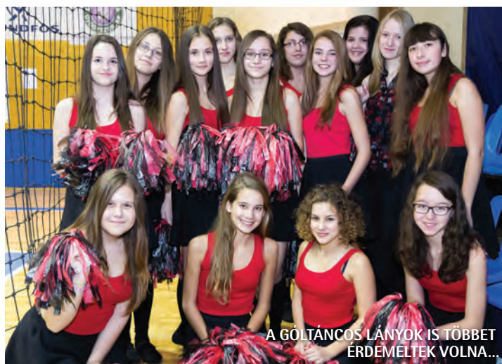
A GÓLTÁNCOS LÁNYOK IS TÖBBET ERDEMELTEK VOLNA...

szakmaiatlanul, hibákkal tele vezette a mérkőzéseket. Tegyük fel, hogy mind a három büntető