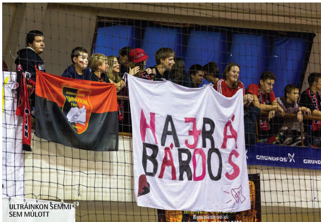
ULTRÁINKON SEMMI SEM MÚLOTT

A második féldőben számos kétes bírói döntés született, melyek miatti felháborodásunknak a Bárdos-szurkolók hangot is adtak. Az Árpád első büntetőjét a kiválóan védő kapusunk még háritotta, de ezután kaptunk egy gólt, a döntő helyzetben védőnket lerántották. Nem sokkal később a játékvezető ismét ellenünk fújt be újabb büntetőt. Sajnos ezt már érvényesítette az Árpád labdarúgója, így a meccs vége 2-2 lett. A részre-