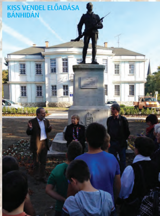
KISS VENDEL ELŐADÁSA BÁNHIDÁN