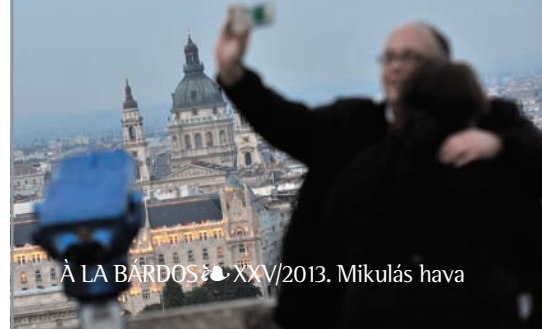
Á LA BÁRDOS XXV/2013. Mikulás hava