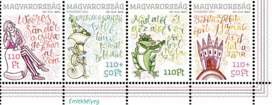
Emlékbélyeg a Magyar Postától

szimfóniákba, szabad versekbe. A filozófiával rokonságot tartó műveiben a világképe is kiszélesedik, színesedik, a világlátása is változik. Az irracionális öslélek feltárásával párhuzamosan alakul ki például sajátos látásmódja a jóról és a rosszról. Az életmű határtalanságát nemcsak a sokféle hagyomány, a rengeteg műfordítás, a műfaji sokszínűség mutatja, hanem az a nyelvi világ is, amely a legrégebb magyar nyelvet a legmodernebbel fogja egybe.