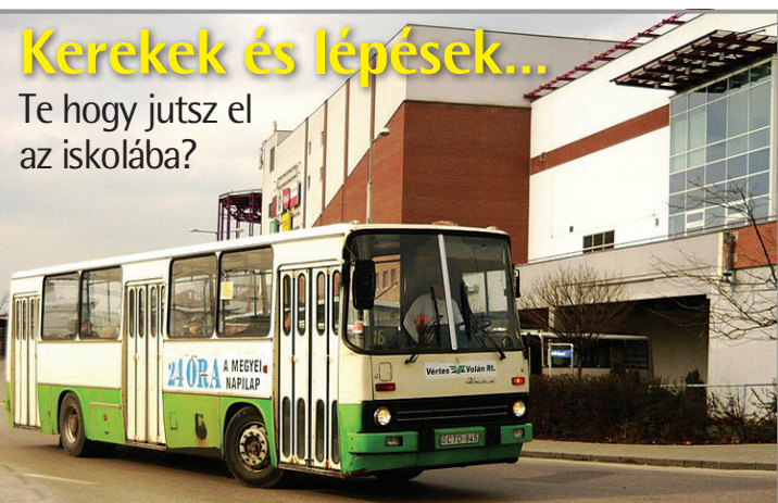
Ráncajtos Ikarus 260-as kanyarodik a Vértes Centernél