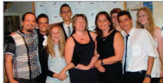
A pedagógusok és a programfelelősök nyolc nap és hét éjszaka szolgálták a 130 tanuló önfelelt nyaralását

Másnap ébresztővel indult a reggel, majd szobaelenőrzést tartottak. Az ellenőrzést a már végzett bárδοςosokból álló animátorcsapat vitte véghez. Majd reggeli következett, közben pedig