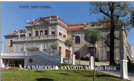
Á LA BÁRDOS ☛ XXV/2013. Mikulás hava