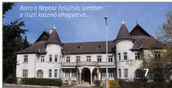
Balra a Népház felújítva, szemben a tiszti kaszinó elhagyatva...