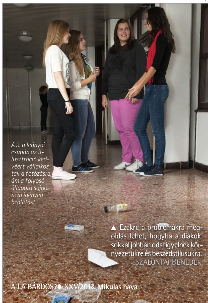
A 9. a leányai csupán az il- lusztráció ked- véért vállalkoz- tak a fotózásra, ám a folyosó állapota sajnos nem igényelt beállítást.

A tanárok számtalanszor szólnak a gyerekekre, de a kérés hiába- való, mert amint az ügyeletesek elmennek, a tanulók folytatják a trágár beszédet. Az ebédlőben egyre több a durva szó, mivel sokszor nincs, aki figyeljen az ét- kező rendjére. Erről Kósik Mónikát kérdtük: „A gyerekek egymás- tól átveszik a beszédstílust, ami a diáktársadalomban éppen trendi.”