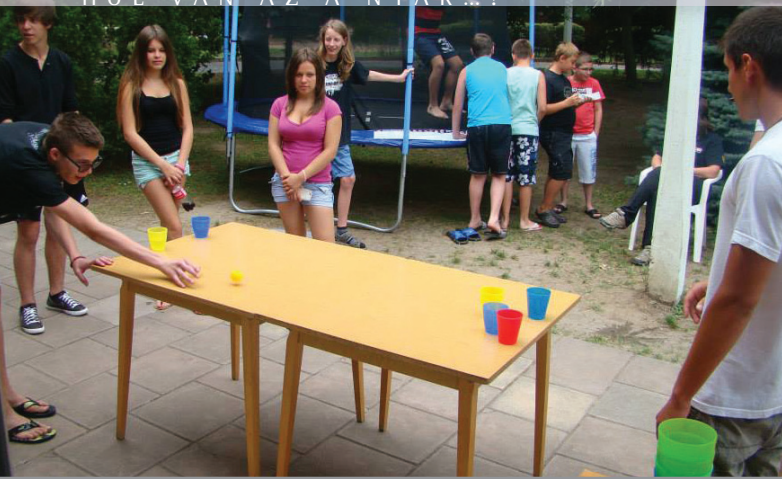
A szörp-pong évek óta a legnépszerűbb sportág a táborban