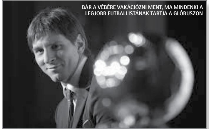
BÁR A VÉBÉRE VAKÁCIÓZNI MENT, MA MINDENKI A LEGJOBB FUTBALLISTÁNAK TARTJA A GLÓBUSZON

Az Aranylabda átadását a szervezők az ünnepség végére helyezték.