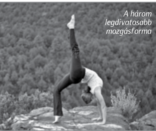
A három legdivatosabb mozgásforma