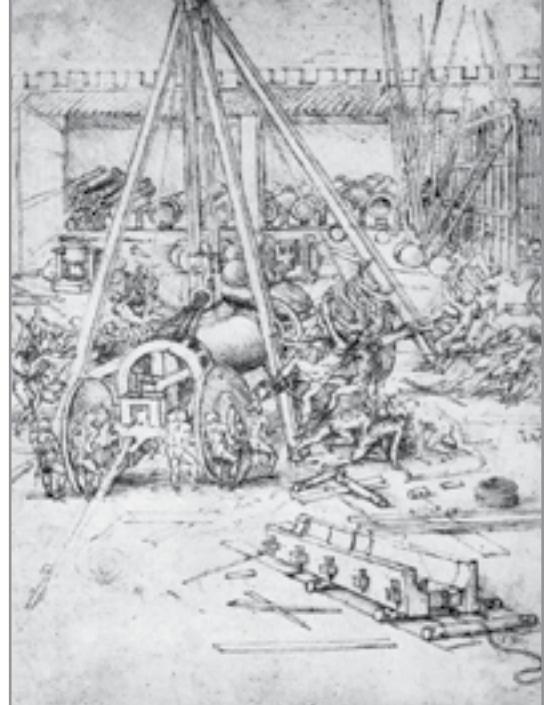
AZ OLDALPÁR KÉPEI AZ INTERNETRŐL SZÁRMAZNAK

Tengeri csaták esetére módszereim vannak védelemre és támadásra egyaránt; bombázásnak ellenálló hajókat építék.”