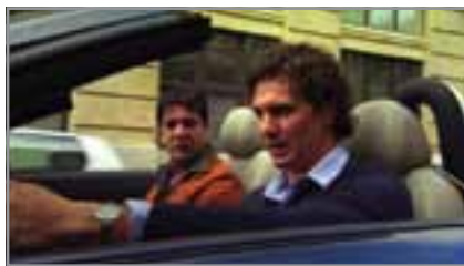
Az egyik film a Kaméleon volt

Január 28-án a diákönkormányzat ismét megszervezte a filmmaratonot. Az alsósok este 6-tól 8-ig, a felsősök egészen hajnalig nézhettek filmeket az iskolában. A filmvetítésre a 109-es, a 110-es és a 112-es terem lett kijelölve. A moziműsor úgy lett összeállítva, hogy mindenki talált a saját ízlésének megfelelő filmet. A 112-es teremben például magyar filmek voltak, de ezek sajnos nem vonzották túlságosan a fiatalokat. Tavaly magán az eseményen sem vett részt túl sok diák, de idén már elég szép számban megjelentek. Kicsik és nagyon egyaránt eljöttek, hogy filmeket nézhessenek