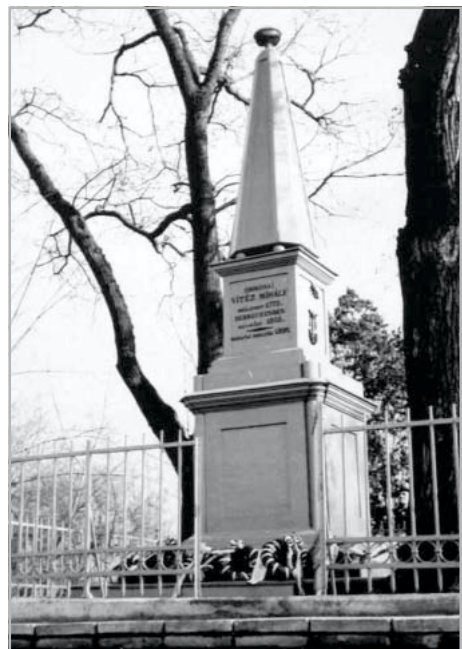
A költő jelképes emlékműve a Hatvani utcai temetőben

Sorsuk hasonló, kis túlzással akár a több mint egy évszázaddal korábban élt Csokonai Vitéz Mihály is írhatta volna a Születésnapomra című meglepetéskölteményt. Csokonainak is éppen harminckett éve „szelelt el”, mondani sem kell, hogy „havi kétszáz” neki se telt. Derűsebb pillanataiban talán nem bánta, hogy ő is „ily töltőtoll koptató szegény legény”, de A méla Tempefői alcíme beszédebb: „az is bolond, aki poétává lesz Magyarországon.” Ez a keserű gondolat előrevetíti azt is, milyen