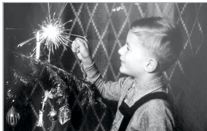
Csillagszórógyújtás hetven évvel ezelőtt

Igenis nagyon szeretem a karácsonyt! Ezt azért szeretném már most az elején leszögezni, mert nem akarom, hogy bárki azt higgye, előre „megrendelt” cikk ez a Karácsonyról. Soha sem a negatív oldalát nézem az adventi tömegnek, hanem örömmel lapozok a naptáromban november végén, s látom meg a december feliratot.